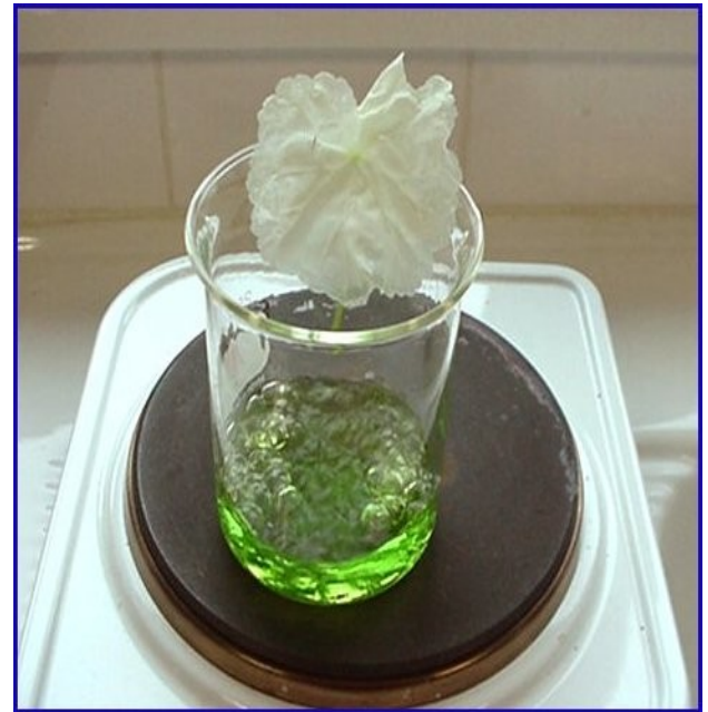
Doc 2 : Décoloration dans l'éthanol bouillant